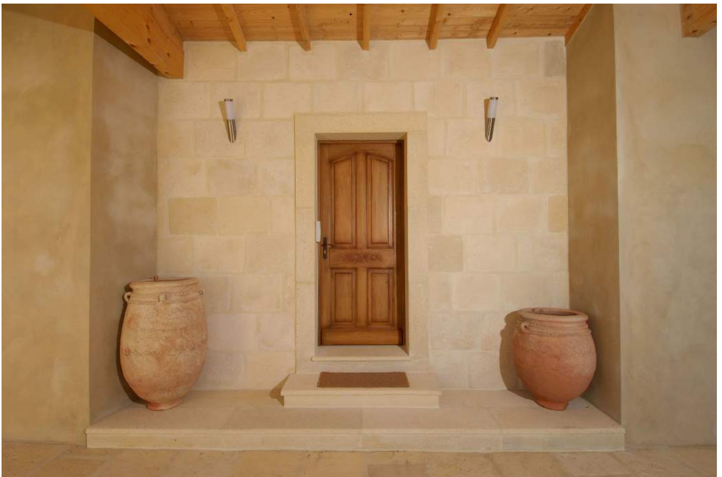
Placage mural et pièces d'angle, dallage, encadrement de porte, marche et seuil de porte