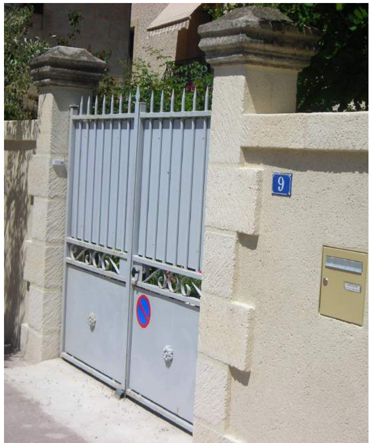
A gauche : Modèle Chaine d'angle 46/23*38*2 - aspect layé - teinte pierre ocrée