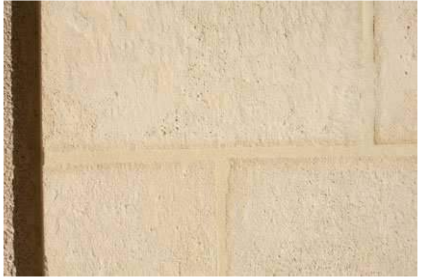
Aspect pierre vieillie. Pour usage intérieur ou extérieur. Epaisseur 2 cm