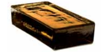
SIENA VETROPIENO - RETTANGOLARE