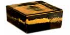
SIENA VETROPIENO - QUADRATO