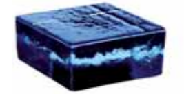
BLU VETROPIENO - QUADRATO