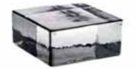
NEUTRO VETROPIENO - QUADRATO