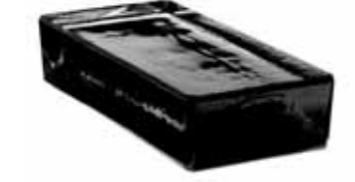
NORDICA VETROPIENO - RETTANGOLARE