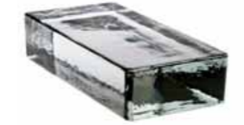
NEUTRO VETROPIENO - RETTANGOLARE