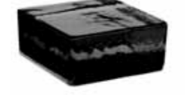
NORDICA VETROPIENO - QUADRATO